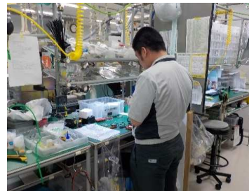
メンテナンス作業室内