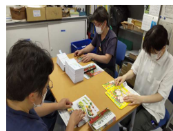
本部各部署からの 多様な依頼に必需