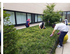
病院敷地内、庭や駐車 場の除草作業