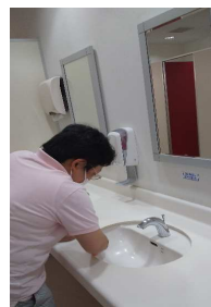
館内清掃やフィルター清掃(本部)