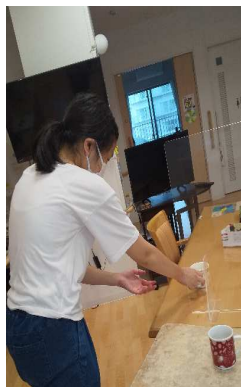
老人保健施設で 利用者に お茶サービス